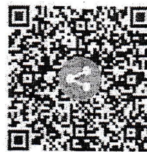
เอกสารประกอบการประชุม

สำนักพัฒนาการป้องกันและแก้ไขปัญหายาเสพติด โทร. ๐ ๒๒๔๗ ๐๔๐๑ - ๑๘ ต่อ ๒๕๐๑๒ โทรสาร ๐ ๒๒๔๕ ๙๐๘๔ ไปรษณีย์อิเล็กทรอนิกส์ itds.oncb@gmail.com