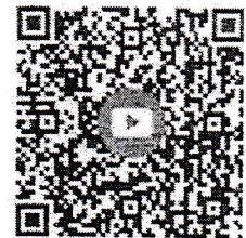
สื่อการบรรยาย